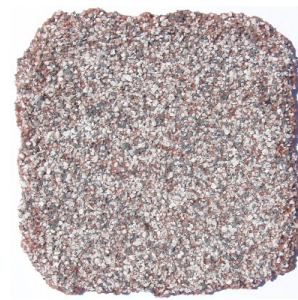
Ral 3009/gris moyen