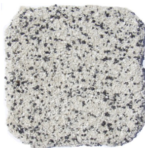
Ral 7035/gris moyen